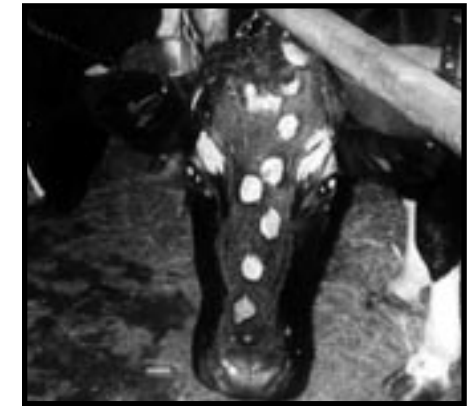
après trois semaines