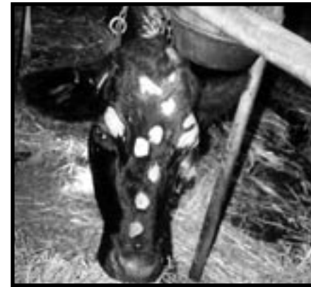
après deux semaines

ENL : Énergie Nette de Lactation : Calculée à partir de l'ADF.