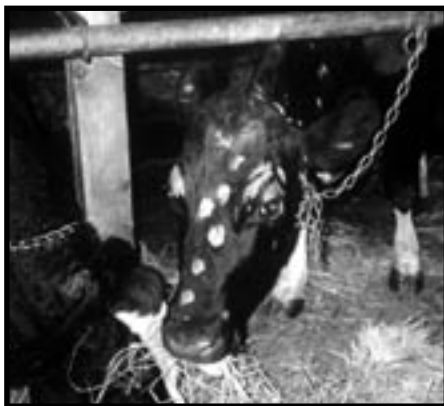
début du traitement

Bien entendu, comme c'est un problème principalement relié au foie, un drainage de ce dernier est fortement recommandé pour accompagner le traitement des dartres, il permet ainsi de se débarrasser du problème plus sûrement.