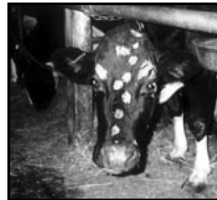
après quatre semaines