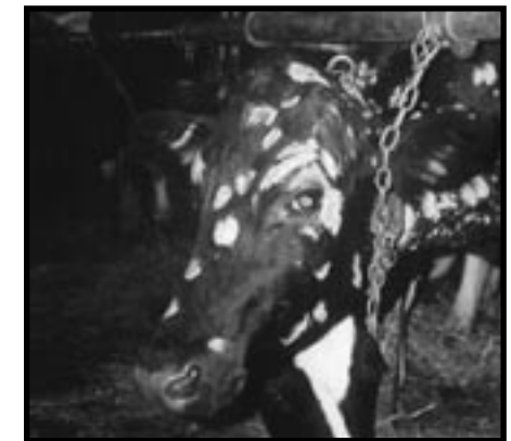
après cinq semaines