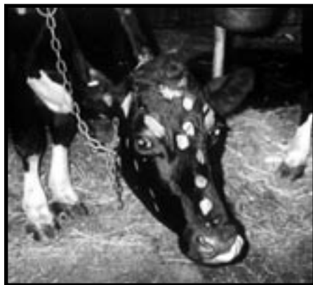
après une semaines