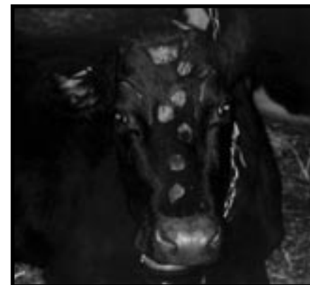
après six semaines