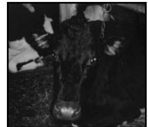
après sept semaines