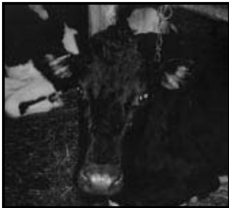
Après sept semaines