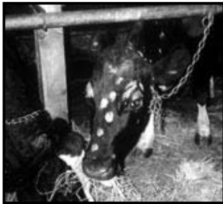
Début du traitement

Bien entendu, comme c'est un problème principalement relié au foie, un drainage de ce dernier est fortement recommandé pour accompagner le traitement des dartres, il permet ainsi de se débarrasser du problème plus sûrement..